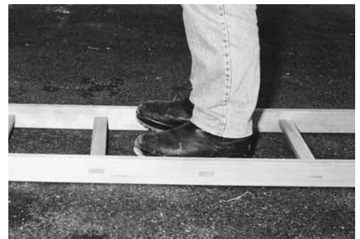
Contrôler régulièrement les montants et les échelons.