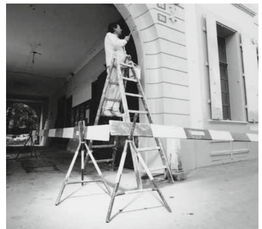
Emplacement protégé d'une échelle dans un lieu de passage.