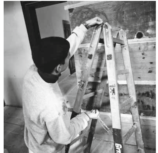
Pour travailler en toute sécurité, des échelles intactes sont une condition sine qua non.